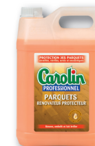
CAROLIN Rénovateur protecteur 5L